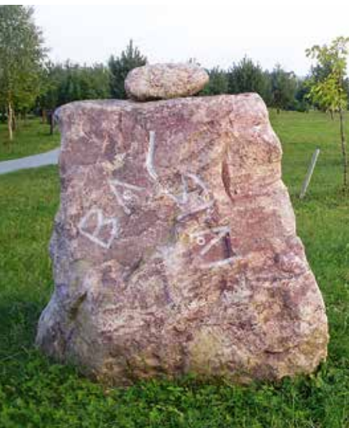
16 Laimės kvadratas 2009 m., skulptorijs Girts Burvis (LV) The Square of Fortune. Girts Burvis (LV), 2009