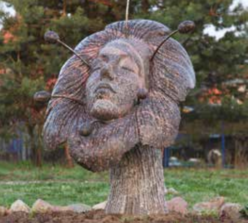
13 Austēja 2008 m., skulptorijs Karlis Ilē (LV) Austēja Karlis Ilē (LV), 2008