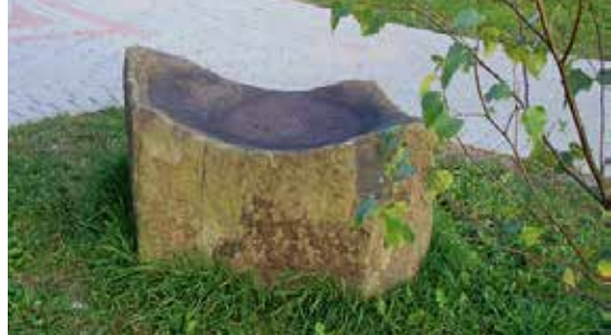
8 Praamžius Originalios Akmens amžiaus girnos Praamžius (name of a supreme God) Original millstone of a Stone Age