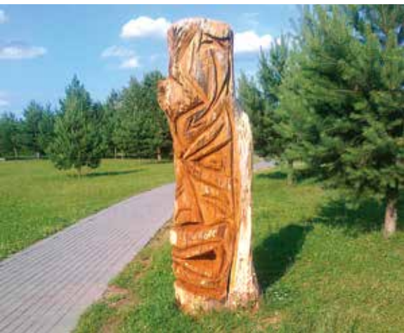
23 Krištastalis autorius Kazys Venclovas 2008 m.